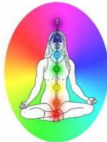
Before Kundalini Reiki I Attunement

Después de la iniciación en Reiki Kundalini nivel-1 los Chacras quedan así: